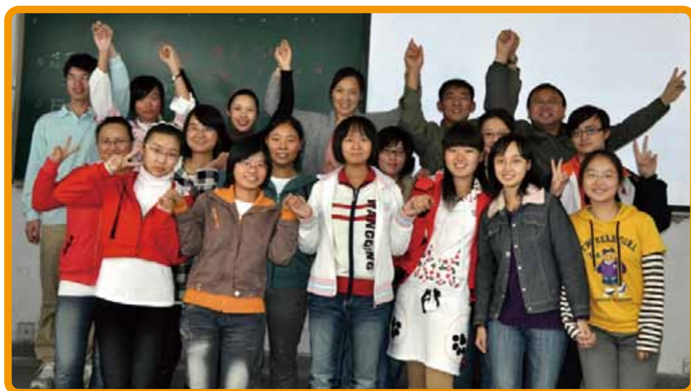
[图] 第二届新生活教育暨阿福童课程北京教师工作坊在北京林业大学举办

10月24日 百特教育与华夏志愿者服务社合作在北京林业大学举办第二届新生活教育暨阿福童课程北京教师工作坊，确定了北京市第一批进入朝阳区打工子弟学校进行阿福童课程支教的志愿者名单。