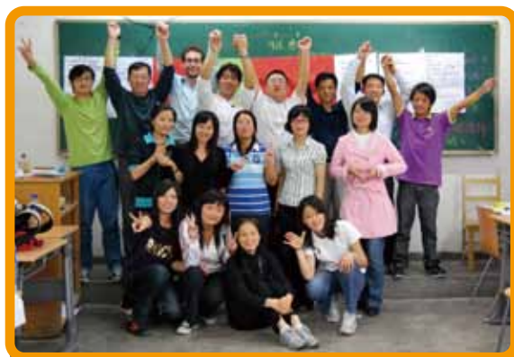
[图] 第一届新生活教育暨阿福童课程北京教师工作坊在北京林业大学举办

9月26日-27日 百特教育与华夏志愿者服务社合作在北京林业大学举办第一届新生活教育暨阿福童课程北京教师工作坊，来自北京大学、北京师范大学、中国青年政治学院、中国民族大学等高校的约20名大学生志愿者参加了工作坊。