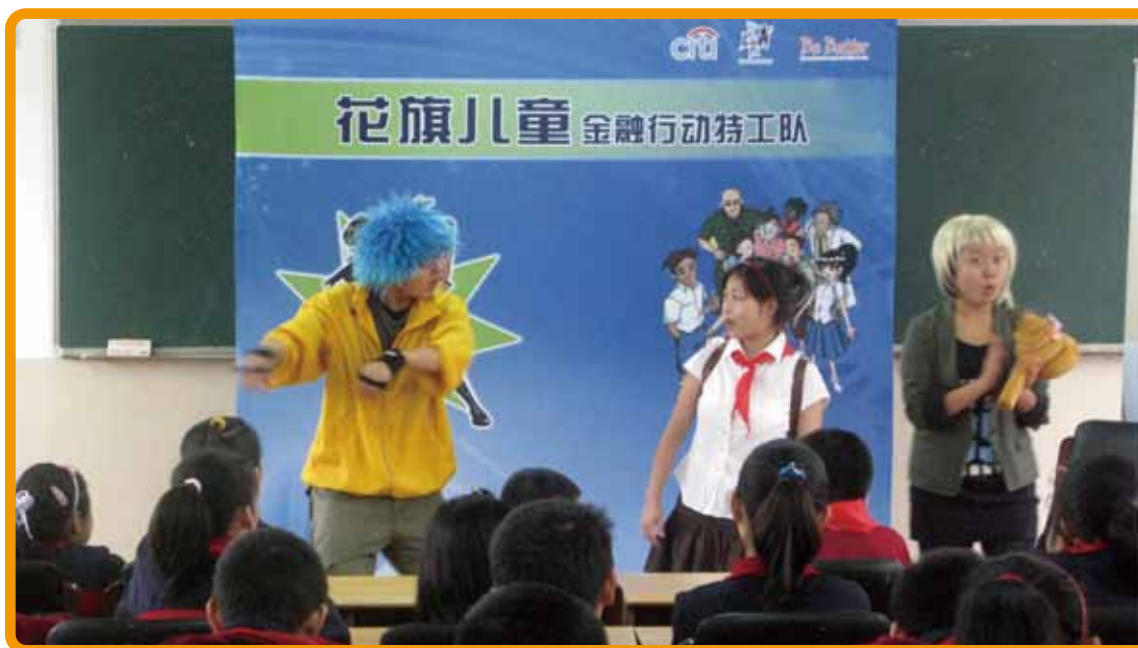
[图]“神探贝妮”儿童理财戏剧在上海市普陀区怒江中学首演

11月11日 “神探贝妮”儿童理财戏剧在上海市普陀区怒江中学上演，怒江中学预备班约100名学生观看了演出，拉开了“神探贝妮”儿童理财戏剧巡演的序幕。