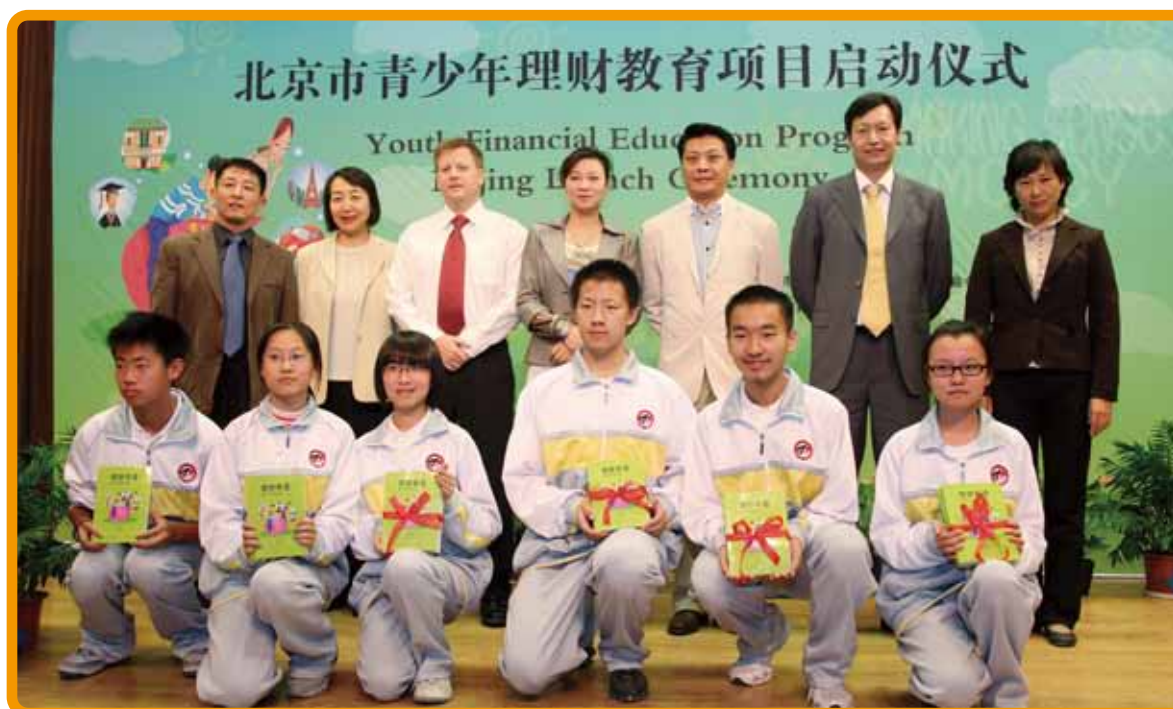
[图] “理财有道”项目启动仪式在北京二中举办

10月16日 百特教育、花旗中国、新加坡培训协会与北京市东城区教委在北京市第二中学举办“理财有道”青少年理财教育项目北京启动仪式，自此将有一万名北京中学生参加“理财有道”项目。